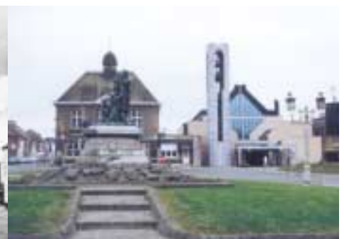
l'Eglise Saint-Rémy sur la Grand-Place avant 1989... et après 1996