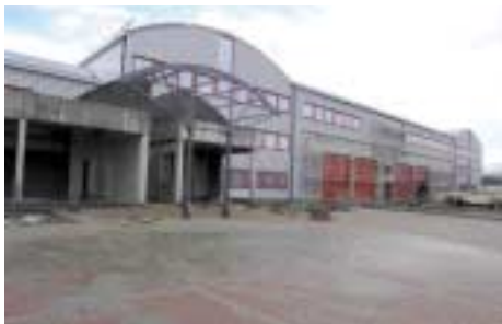
Bientôt, le service incendie prendra ses quartiers sur le zoning de Cuesmes

Musée St-Rémy : Eglise St-Rémy Grand-Place - 7033 Cuesmes Information : Freddy Godart, tel : 065/31.36.49 Uniquement pour les groupes et sur réservation.