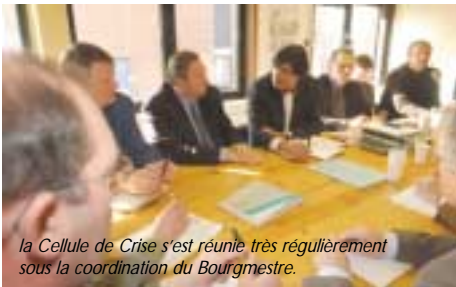
la Cellule de Crise s'est réunie très régulièrement sous la coordination du Bourgmestre.