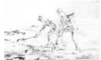
« Les Bêcheurs », l'une des premières œuvres recensées du célèbre peintre

Il se consacre alors à son art. Eperdument. Il dessine des travailleurs de la mine mais aussi des paysans. Vincent voue une véritable admiration à Jean-François Millet (perceptible dans "l'Angélus") et il s'en inspire très largement pour ses "bêcheurs", l'une des premières œuvres recensées du célèbre peintre. Dans les années 80, la Ville de Mons acquiert ce dessin au fusain auprès de Christie's à Londres.