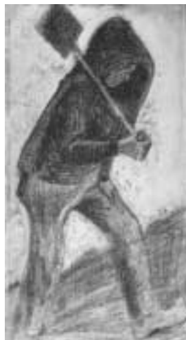
La condition des mineurs a profondément inspiré Vincent Van Gogh

C'est une maison coquette, se distinguant des autres. Vincent voulant partager la vie des mineurs, il la trouve trop luxueuse. Du coup, il loue une cabane. Il se livre tout entier à sa charge d'évangéliste, multipliant les visites, sacrifiant peu à peu son indemnité, ses vêtements, sa nourriture et tout son temps aux mineurs et à leurs familles. Il devient "mineur parmi les mineurs".