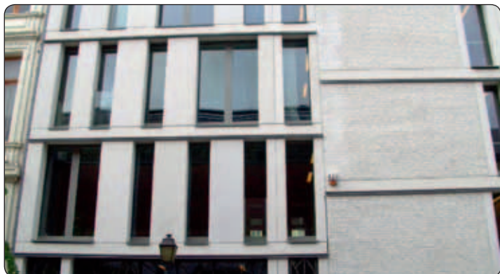
^ Inscrire son enfant dans une école de quartier