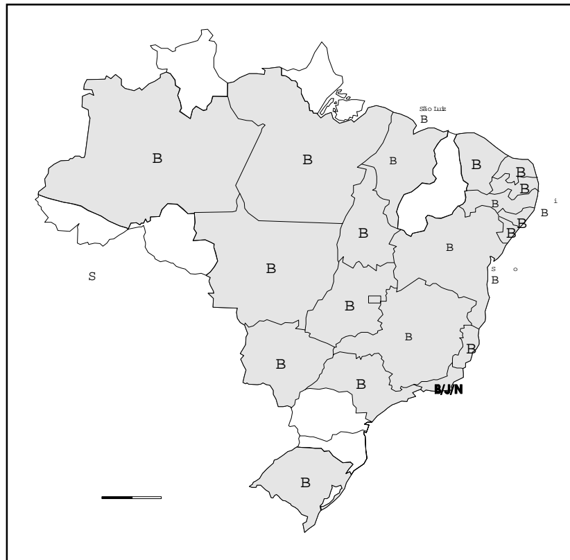
Figura 2 - Mapa de concentração de falantes bantos e oeste-africanos no Brasil

sílabas contíguas, pela intromissão de uma vogal entre elas, que termina por produzir outra sílaba, a exemplo de *saravá para salvar, *fulô para flor.